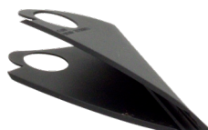
Ref : 6721

Gaine flexible annelée fendue longitudinalement avec spirale renforcée à paroi intérieure annelée. La gaine souple de passage de réseau souterrain est utilisée pour la protection et le repérage des câbles fibre optique et des faisceaux. Différentes couleurs sont disponibles pour les différents opérateurs télécom.