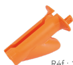
Ref : 1143