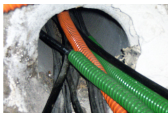
Déployée dans une chambre télécom