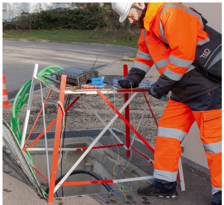
Utilisation avec le plateau de travail TED® : Réf : 35001