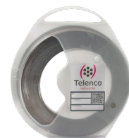
Feuillard largeur 20 mm SB20x