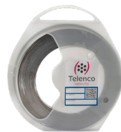
Feuillard largeur 10 mm SB10x

Feuillard inoxydable 50 m (vendu par carton de 5 rouleaux)