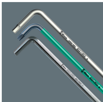
Gravure laser pour identifier les clés