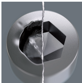
Profil 6 pans optimisé