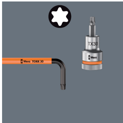
Code couleur par taille pour une identification rapide