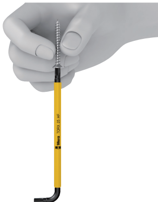
Maintient toutes les vis Torx