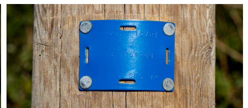
Par quatre clous ardoisiers