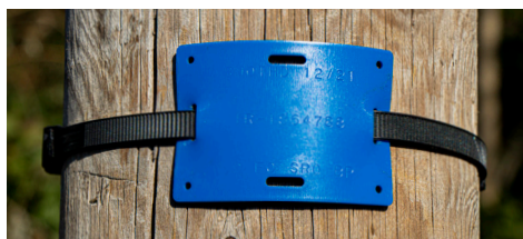
Par un collier de serrage jusqu'à 10 mm de largeur